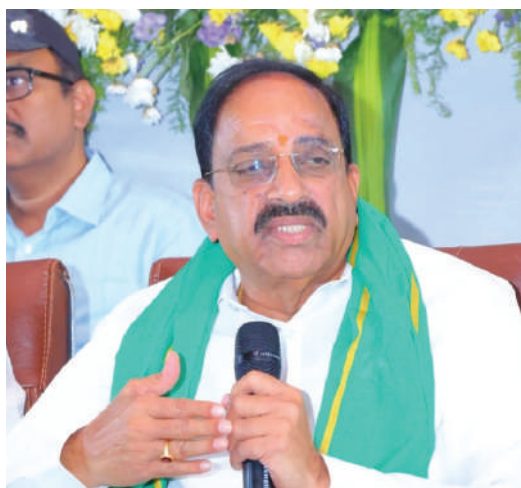
● రాష్ట్ర మంత్రులు తుమ్మల నాగేశ్వర్ రావు పాస్టం ప్రభాకర్, సిద్దిపేట, మార్చి 21 (ప్రజా తీర్పు)