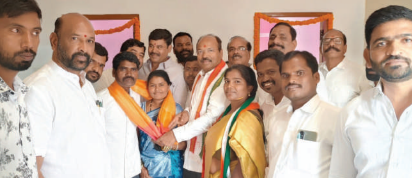
వైయార్గిల మహేశ్వరం ప్రజాతీర్పు లిపోర్టర్) మార్చి 26