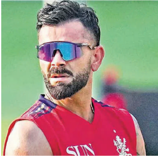
ఈసారి ఎలాంటి ఆరంభ వేడుకలు లేకుండానే ఐపీఎల్ సాధానీదాగా మొదలుకానుంది. గతేడాది తొక్కినలాటలో

అభిమానులు ఎప్పుడెప్పుడా అని ఎదురుచూస్తున్న క్రికెట్ పండుగ రానే వచ్చింది. మండు వేసవిలో ఇంటిల్లిపాడిని అలరించేందుకు అన్ని హంగులతో ఐపీఎల్ ముసాఫిరింది. సొంతగడ్డపై ప్రతిష్టాత్మక టీ20 ప్రపంచకప్ విజయాన్ని ఆస్వాదిస్తూనే ఐపీఎల్ మజాను పొందేందుకు ఫ్యాన్స్ ఆసక్తితో ఎదురుచూస్తున్నారు. 18 సీజన్లు విజయవంతంగా పూర్తి చేసుకుని 19వ సీజన్లోకి అడుగుపెడుతున్న ఐపీఎల్.. ఈసారి మరింత జోష్ను అందించడం ఖాయంగా కనిపిస్తున్నది. పొట్టి ప్రపంచకప్తో కోట్లాది మంది అభిమానుల కల నెరవేరిన వేళ ఐపీఎల్ రెట్టింపు క్రేజ్తో దుమ్మురేపే అవకాశముంది. శనివారం చిన్నస్వామి స్టేడియం వేదికగా డిఫెండింగ్ చాంపియన్ రాయల్ చాలెంజర్స్ బెంగళూరు(ఆర్సీబీ), సన్రైజర్స్ హైదరాబాద్(ఎన్ఆర్ఐహెచ్) జట్ల మధ్య పోరుతో ఐపీఎల్కు అధికారికంగా తెరలేపనుంది. గతానికి భిన్నంగా