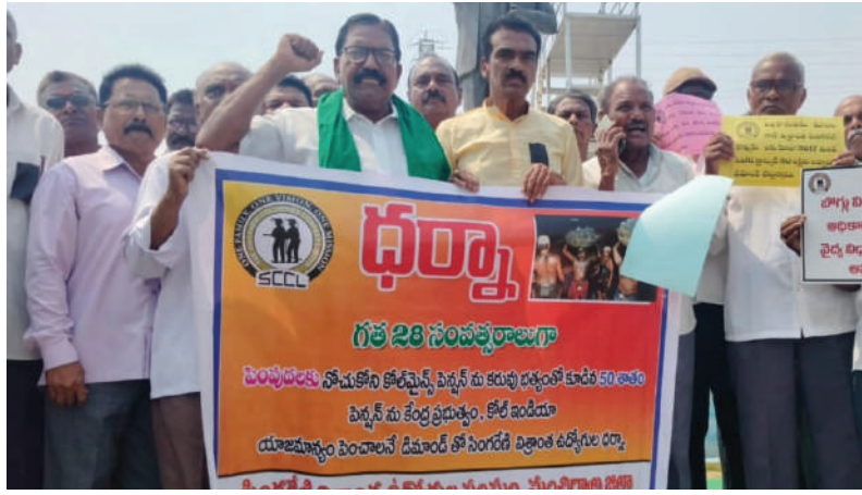
● ధర్మాకు సింగరేణి విశ్రాంత ఉద్యోగుల సంఘం సంగీతావంగా, మద్దతుగా ధర్మా. ● మంచురాల జిల్లా కేంద్రంలోని ఐబి చౌరస్తా వద్ద సింగరేణి విశ్రాంత ఉద్యోగుల భారీ నిరసన ప్రదర్శన (దండే భూమన్ ప్రజాతీర్పు మంచురాల) మార్చి 30

మంచురాల జిల్లా కేంద్రంలోని ఐబి చౌరస్తా అంబేద్కర్ విగ్రహం ఆవరణలో కోల్ ఇండియా లోని బోగ్ పెన్షనర్లకు పెన్షన్ పెంపుదల చేయాలనే డిమాండ్ తో న్యూ ఢిల్లీ లోని జంతర్ మంతర్ వద్ద కోల్ పెన్షనర్లు చేస్తున్న ధర్మాకు మంచురాల జిల్లా సింగరేణి విశ్రాంత ఉద్యోగుల సంఘం, ఢిల్లీ లో వారు చేస్తున్న ధర్మాకు సంఘీభావం తెలుపుతూ మద్దతుగా ఈరోజు న నల్ల బ్యాండ్ లు ధరించి ప్లే కార్డ్స్ చేత పూసి పెద్ద ఎత్తున ధర్మా కార్యక్రమాన్ని నిర్వహించారు. ఈ సందర్భంగా పలువురు నాయకులు మాట్లాడుతూ 1998 సంవత్సరం లో చేసుకున్న ఒప్పందం మేరకు ప్రతి మూడు సంవత్సరాలకు ఒకసారి మార్చిలో లో పెరుగుతున్న ధరలకు అనుగుణంగా పెన్షన్ పెంచాలని అగ్రిమెంట్ ఉన్న గత 28 సంవత్సరాల నుండి ఒక శాతం పెన్షన్ పెంచకపోవడం పట్ల తీవ్రంగా కోపించారు. కరువు భత్యం తో కూడిన 50% శాతం కోల్ పెన్షన్ పెన్షన్ పెంచాలని ఈ సందర్భంగా డిమాండ్ చేసినారు. సింగరేణి విశ్రాంత ఉద్యోగులకు కనీస పెన్షన్ గా 15,000 వేలు చెల్లించాలని