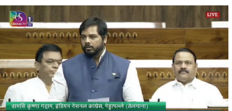
పార్లమెంట్లో తెలంగాణ హక్కులపై గట్టిగా స్వరం వినిపించిన పెద్దపల్లి ఎంపీ

మొక్కజొన్న ఎకరా 40 క్వింటాళ్ళ వచ్చే అవకాశం ఉంది పంటల మద్దతు ధరకు సంబంధించి మొక్కజొన్న కేంద్రాల ఏర్పాటు చేయాలని గత రెండు వారాలు నుండి రైతాంగ ప్రభుత్వం దృష్టికి తీసుకెళ్లడం కానీ ప్రభుత్వం మొక్కజొన్న కేంద్రాల ఏర్పాటు చేస్తున్నట్లు పేర్కొనడం కానీ ఇంతవరకు మొక్కజొన్న కేంద్రాల ఏర్పాటు చేయలేదు మార్కెట్లో మొక్కజొన్న క్వింటాళ్ళు 1800 1900 ఎక్కువ