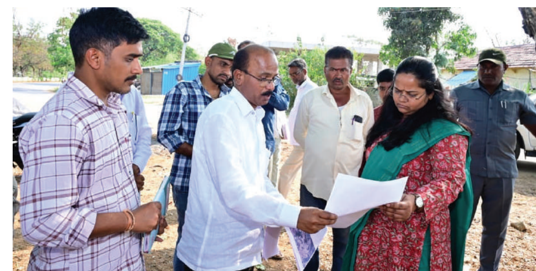
నిర్వహణ చేసే ప్రక్రియ ఎలాంటి తప్పిదాలకు తావు లేకుండా చేసేందుకు తగు సూచనలు సలహాలు ఇచ్చారు. ఈ కార్యక్రమంలో స్థానిక తహసీల్దార్, ఎంపీడీవోలు అధికారులు పాల్గొన్నారు.

పక్కద్దురిగా జనగణన మొదటి విడతలో చేపట్టే ఇండ్ల గణన బ్లాకుల రూపకల్పన పటిష్టంగా చేపట్టాలని జిల్లా కలెక్టర్ ప్రతిమా సింగ్ తాసిల్దార్లను ఆదేశించారు. బుధవారం టేక్వాలి మండల కేంద్రంలోని ఇండ్ల గణన ఏర్పాట్లను పరిశీలించారు. ఈ సందర్భంగా జిల్లా కలెక్టర్ ప్రతిమా సింగ్ మాట్లాడుతూ.. జన గణన మొదటి దశలో భాగంగా చేపట్టే ఇండ్ల గణన ప్రక్రియ వచ్చే నెల మే 11 నుంచి జూన్ 09 వరకు నిర్వహించే ఇండ్ల గణనకు ఎలాంటి పొరపాట్లకు తావు లేకుండా పక్కద్దురిగా నిర్వహించాలని జిల్లా కలెక్టర్ అధికారులను ఆదేశించారు. ఇండ్ల గణన జాబితా బ్లాక్ లను తయారు చేయడానికి మండలంలోని ఒక రెవెన్యూ గ్రామాన్ని యూనిట్ గా తీసుకుని గరిష్టంగా 300 ఇండ్లు లేదా 800 జనాభా ఉండేట్లు ఇండ్ల గణన బ్లాక్ లను జమీమీ పోర్టల్ ద్వారా తయారు చేయాలన్నారు. ఎలాంటి తప్పిదాలు లేకుండా పటిష్టంగా జనగణన బ్లాకుల రూపకల్పన ప్రక్రియ సమర్థవంతంగా నిర్వహించాలన్నారు జమీమీ పోర్టల్