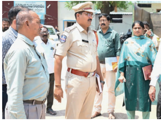
ఎన్నికను ప్రశాంతంగా, పారదర్శకంగా నిర్వహించాలని