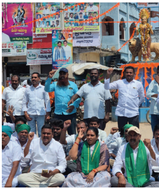
లేక కాంగ్రెస్ ప్రభుత్వం రైతులను అరిగిన పెడుతుందని అన్నారు.

• అకాల వర్షాలు, ఈదురు గాలులతో సగం వరకు పంట నష్టపోయిందని మిగతా సగం పంట చేతికొచ్చేసరికి కొనుగోలు కేంద్రాలు ప్రారంభించక మరియు మద్దతు ధర