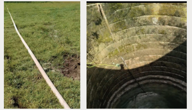
చెన్నారావుపేట, ఏప్రిల్ 8 (ప్రజా తీర్పు)

నల్లాల బావి నుండి ఓ రైతు సొంత బావిలోకి నీటిని పంపింగ్, పసుపు తడిపంటల డబ్బు