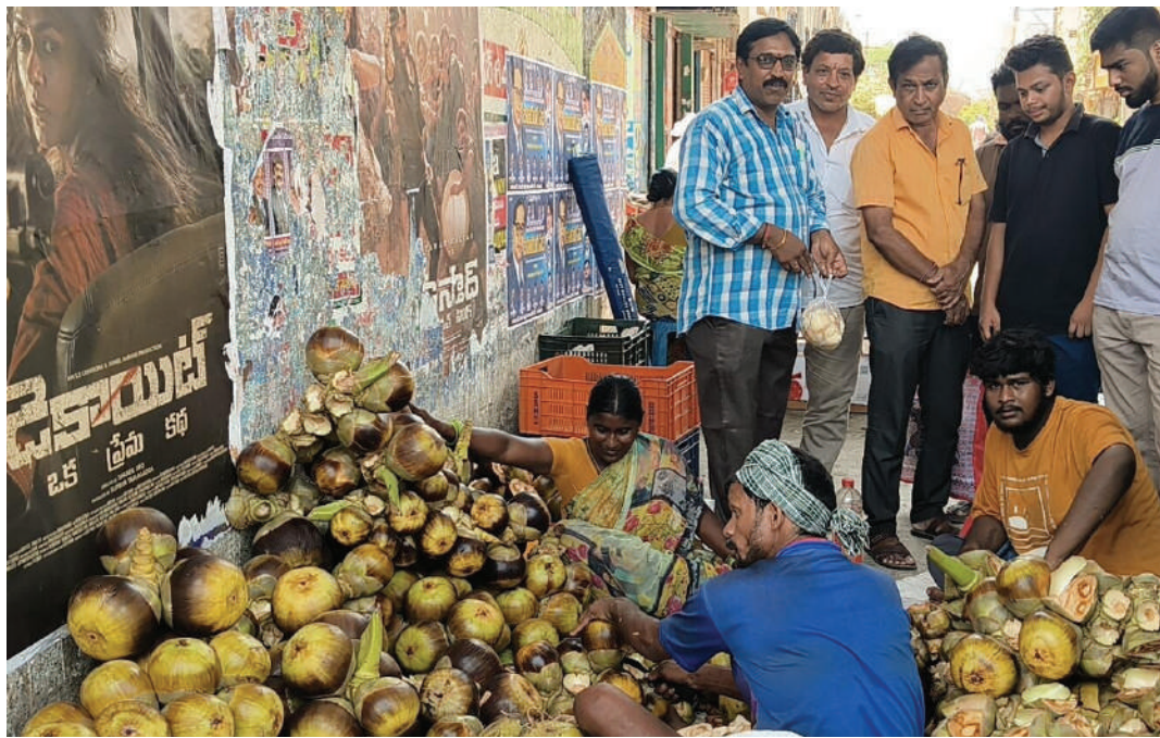
పానీయాల కంటే తాటి ముంజలు ఆరోగ్యానికి ఎంతో శ్రేయస్కరమని స్థానికులు అభిప్రాయపడుతున్నారు. తాటి ముంజల వ్యాపారులు మాట్లాడుతూ... ఇవి కేవలం దాహాన్ని తీర్చడమే కాకుండా, శరీరానికి చలవను ఇస్తాయని వైద్యులు కూడా సూచిస్తుండటంతో ముంజలకు గిరాకీ పెరిగింది. వేసవిలో వచ్చే అనారోగ్య సమస్యల నుండి ఉపశమనం పొందడానికి ముంజలు ఒక మంచి సహజ సిద్ధమైన ఆహారమని వారు పేర్కొన్నారు.

భానుడి భగభగలకు జనం అల్లాడిపోతుండటంతో, వేసవి తాపాన్ని తీర్చుకునేందుకు ప్రకృతి ప్రసాదించిన 'ఐస్ యాపిల్' తాటి ముంజల వైపు జమ్మికుంట ప్రజలు మొగ్గు చూపుతున్నారు. పట్టణంలోని షైట్ వర్ కింద సిటీకేబిల్ లైన్ సమీపంలో తాటి ముంజల విక్రయాలు జోరుగా సాగుతున్నాయి. జమ్మికుంట పట్టణ కేంద్రంలో తాటి ముంజల విక్రయదారులు పెద్ద ఎత్తున ముంజలను అందుబాటులోకి తెచ్చారు. ఎండ తీవ్రత దృష్ట్యా అటుగా వెళ్లే బాటవారులు, వాహనదారులు ఆగి నిమిషాల తరబడి వేచి చూసి ముంజలను కొనుగోలు చేస్తున్నారు. విక్రయదారులు ముంజలను ఎప్పటికప్పుడు తీసి వినియోగదారులకు అందిస్తుండగా, ప్రజలు ఆసక్తిగా కొనుగోలు చేస్తున్నారు. ఆరోగ్యానికి ఎంతో మేలు కృత్రిమ