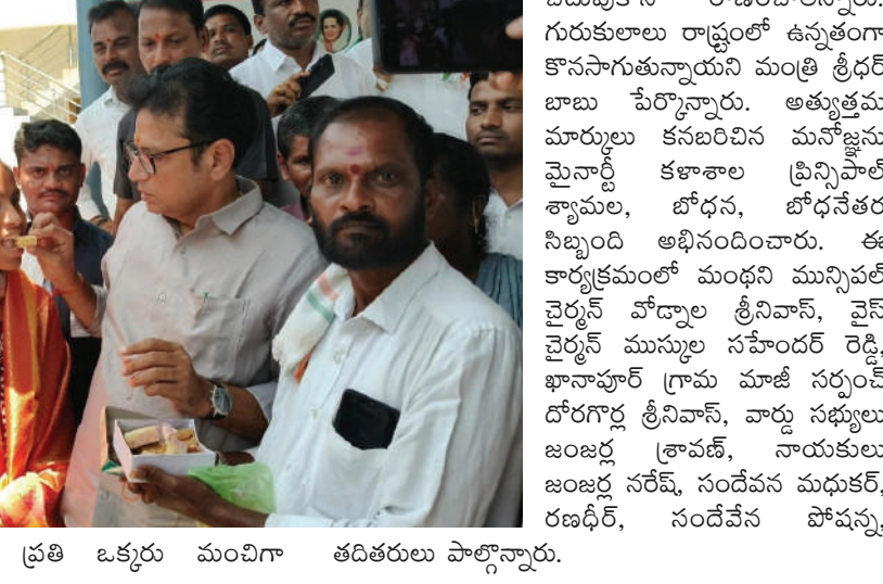
అందుబాటులో ఉందని, ప్రతి ఒక్కరు మంచిగా తదితరులు పాల్గొన్నారు.