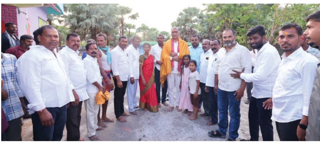
వారికి కూడా మంజూరు చేపిస్తా...