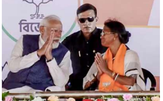
ఉందరు. మార్పు కావాల్సిందే... బీజేపీ సర్కార్ రావాల్సిందే అని బెంగాల్ ప్రతిఢ్వనిస్తోంది" అని మోదీ అన్నారు.