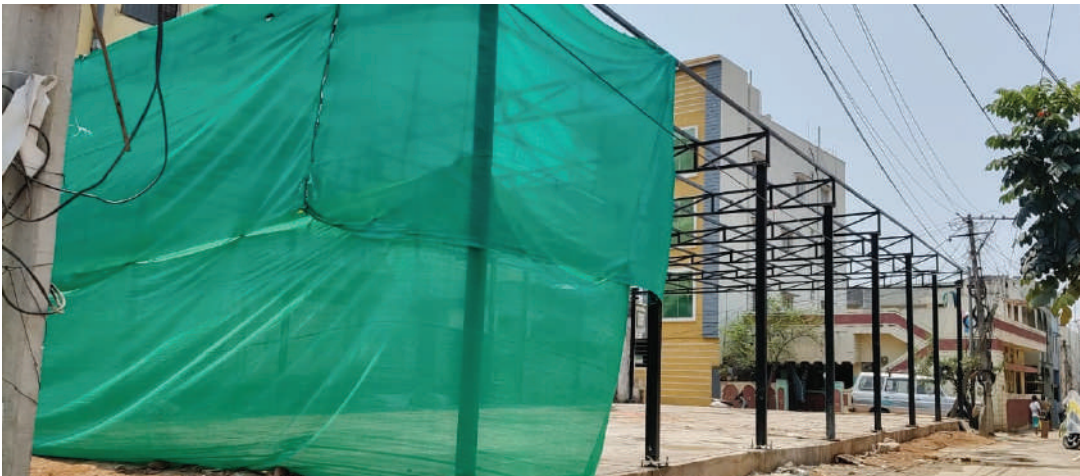
టీ-పాస్ అనుమతులు ఎక్కడ?.. ఫిర్యాదులపై స్పందన లేక ప్రజలు నేరుగా సీడీఎంపి, సీఎం బికా (ఎన్ఐ, ప్రజా తీర్పు మేడ్చల్ మల్కాజిగిరి) ఏప్రిల్ 25

మేడ్చల్ మల్కాజిగిరి జిల్లా మల్కాజిగిరి జి ఎం ఎం సి పరిధిలో పెరుగుతున్న అక్రమ నిర్మాణాలపై ప్రజల్లో ఆందోళన రోజురోజుకూ పెరుగుతోంది. వినాయక నగర్ ప్రధాన రహదారుల వెంట పెద్దగాయత్రి నగర్ కాలనీ, మల్కాజిగిరి, మీర్జా గూడ, పి వి కి కాలనీ, ఓల్డ్ సఫిల్ గూడ దర్గా, నేరేడ్వోల్ త్రి టెంపుల్స్ సమీపంలో వాణిజ్య భవనాలు, అనుమానాస్పద నిర్మాణాలు వేగంగా సాగుతున్నప్పటికీ, వాటికి టీ-పాస్ అనుమతులు ఉన్నాయా లేదా, ఉన్న అనుమతులకు విరుద్ధంగా నిర్మాణాలు