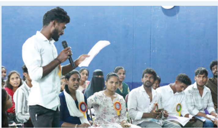
సిద్దిపేట జిల్లా యువజన, క్రీడా వ్యవహారాల శాఖ అధ్యక్షులతో యువతీ యువకులతో "యూత్ పార్లమెంట్" నిర్వహణ