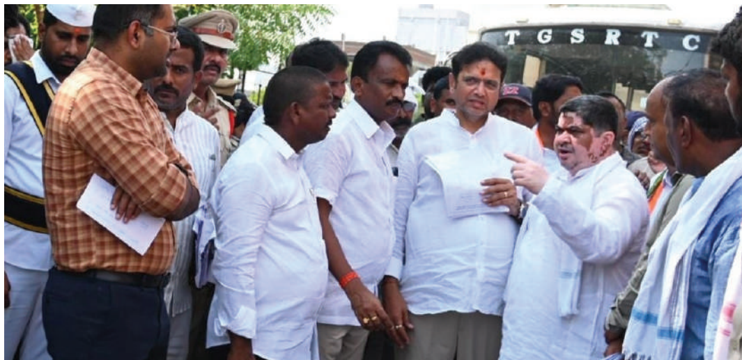
కుంభమేళను తలపించే స్థాయిలో గోదావరి పుష్కరాలు నిర్వహించేందుకు సమగ్ర కార్యాచరణ సిద్ధం చేస్తున్నారని చెప్పారు. కాగా..తెలంగాణ ఐటీ మంత్రి దుద్దిల శ్రీధర్ బాబు, ప్రత్యేక చొరవ తో సర్పంచ్ సుందరం గా మంథని నడి ఒడ్డున గల బస్టాండు భవన నిర్మాణ పనులను త్వరలో చేపట్టనున్నారు.

పెద్దపల్లి జిల్లా మంథని అభివృద్ధి సిగ్లో మరో మణిహారం చేరనున్నది. రూ.3 కోట్లతో అధు నాతన హంగులతో మంథని, కాళేశ్వరం బస్టాండ్ల అభివృద్ధికి అవసరమైన నిధులు మంజూరు చేసినట్లు మంత్రి పొన్నం ప్రభాకర్ తెలిపారు. ఈ బస్టాండ్ల అభివృద్ధి ప్రజా రవాణా సేవలు మరింత మెరుగుపడతాయని, పొన్నం ప్రభాకర్ తెలిపారు. దీనిలో భాగంగా.. మంత్రి శ్రీధర్ బాబు మాట్లాడుతూ.. మంథని బస్టాండ్లో రెండు అదనపు ఫ్లాట్ ఫారాల నిర్మాణం కోసం 74 లక్షలు ఇతర అభివృద్ధి పనులకు 19 లక్షలు మంజూరు చేసినట్లు తెలిపారు. అదివారం మధ్యాహ్నం తెలంగాణ రాష్ట్ర రవాణా శాఖ మంత్రి పొన్నం ప్రభాకర్, ఐటీ పరిశ్రమల శాసనసభ వ్యవహారాల శాఖ మంత్రి శ్రీధర్ బాబు, తో పాటు పెద్దపల్లి జిల్లా కలెక్టర్ కోయ శ్రీహర్షతో కలిసి మంథని బస్టాండ్ అభివృద్ధి పనులకు శంకుస్థాపన చేశారు. ఈ సందర్భంగా మంత్రి పొన్నం ప్రభాకర్ మాట్లాడుతూ.. 2027 లో నిర్వహించే గోదావరి పుష్కరాల కోసం ప్రభుత్వం కేబినెట్ సభ కమిటీని నియమించింది