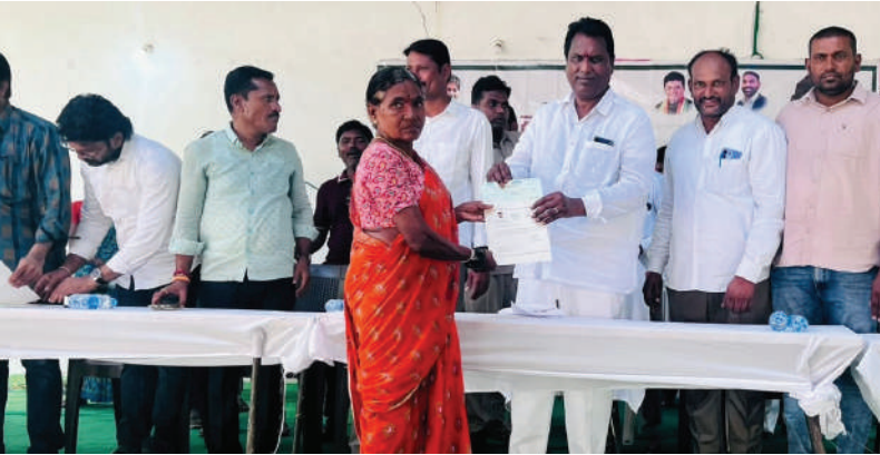
(ఎలుక భగవాన్ యాదవ్, ప్రజాతీర్పు, ఎంఓపి) జూన్ 17:

జగిత్యాల జిల్లా ధర్మపురి నియోజకవర్గం వెల్లూర్ మండలంలో లబ్ధిదారులకు మంజూరైన కళ్యాణ లక్ష్మి, సీఎంఆర్ఎఫ్ చెక్కులను రాష్ట్ర సంక్షేమ శాఖ మంత్రి అడ్డూరి లక్ష్మణ్ కుమార్ పంపిణీ చేశారు. ఈ సందర్భంగా మంత్రి మాట్లాడుతూ గత బీఆర్ ఎస్ ప్రభుత్వ హయాంలో కళ్యాణ లక్ష్మి, ముఖ్యమంత్రి సహాయనిధి చెక్కుల కొరకు లబ్ధిదారులు కఠినగర్ వెళ్లే పరిస్థితి ఉండేదని, నేడు ప్రజా ప్రభుత్వంలో ధర్మపురి నియోజకవర్గంలోని మండల కేంద్రాల్లోని లబ్ధిదారులకు చెక్కులు పంపిణీ చేస్తున్నామని అన్నారు. నలుగురు లబ్ధిదారులకు కళ్యాణ లక్ష్మి చెక్కులతో